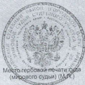
Место гербовой печати суда (мирового судьи) (М.П.)